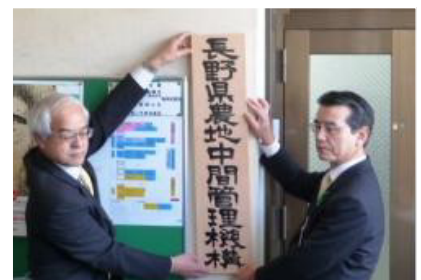
[4月1日 長野県農地中間管理機構発足]