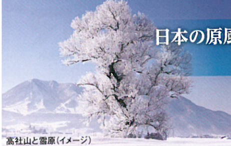
高社山と雪原(イメージ)