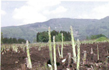
アスパラガス畑 (イメージ) 甘みが特徴の飯山産アスパラガス。