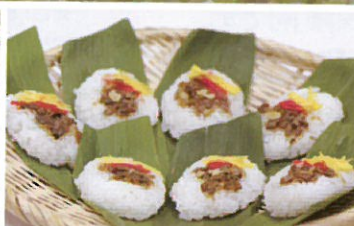
笹ずし (イメージ) 戦国時代から伝わる郷土食。